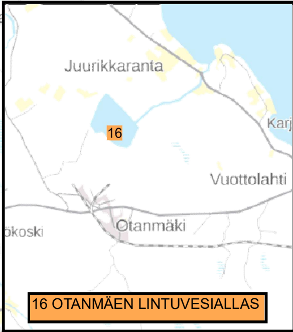
16 OTANMÄEN LINTUVESIALLAS